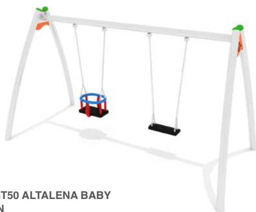
HPST50 ALTALENA BABY LION