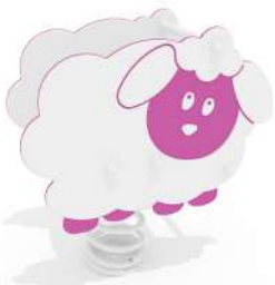
HPST164 GIOCO A MOLLA PECORELLA