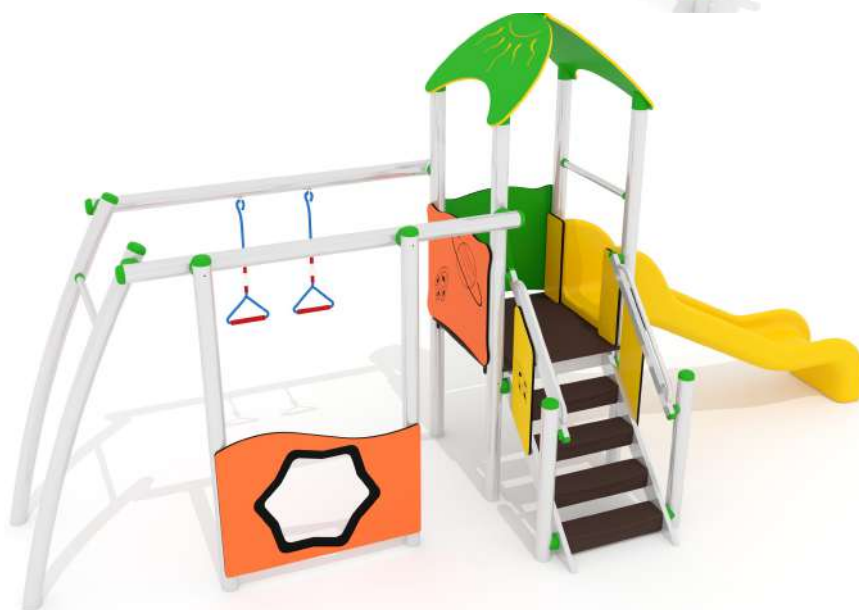
HPST521 TORRETTA TIGER CON PALESTRA